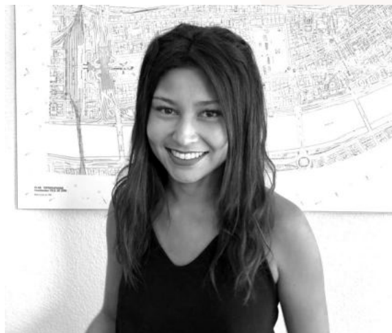
Valentine RAT-PATRON Transaction